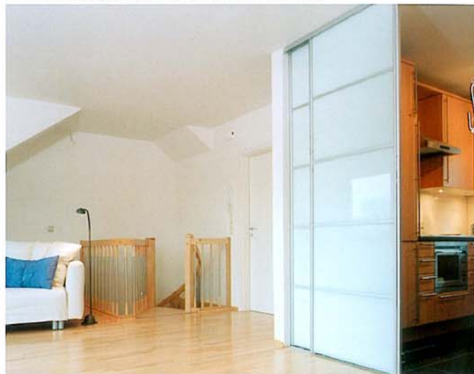
Uma solução durável e estética para revestir paredes e portas (sgc 12 Extra-blanc).